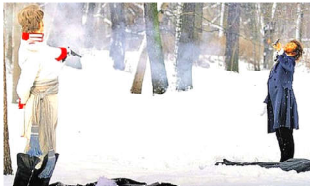
О. ЦАПЕНКО. Фото из открытых источников.

Дантес стрелял в поэта чести В угоду жалкой личной мести. Кусок смертельного свинца Нам и поныне рвёт сердца. Сразил поручик «Солнце наше», Что звёзд на небе было краше. То Пушкин – гений неземной – Погиб от пули роковой. Столетия в скорби и печали Прошли с тех пор, как потеряли Мы божество волшебных строк... Земной поклон прими, Пророк!